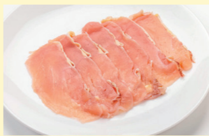
熟れ鶏-7 冷凍 受注生産 NEW