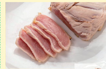
熟れ鶏-9 冷凍 NEW

※タタキは取扱い・調理に注意が必要なため、それらを記載した確認書をご用意しています。初めての注文の際にお申し付けください。