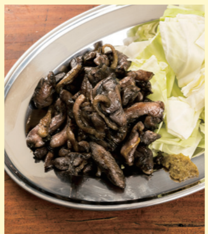
熟れ鶏-10 冷凍 NEW