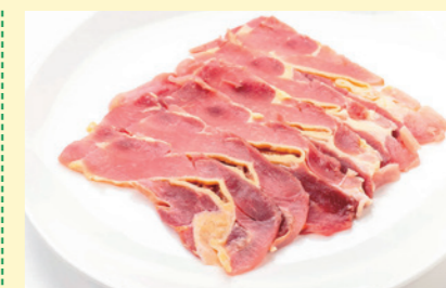
熟れ鶏-6 冷凍 受注生産 NEW

モモとムネ5割ずつのミックスです。粗さ(3mm、9mm、12mm)をご指定ください。