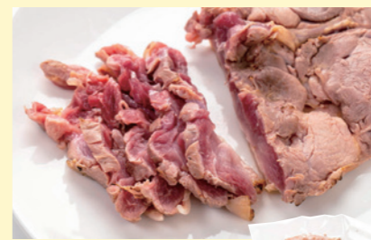
熟れ鶏-8 冷凍 NEW