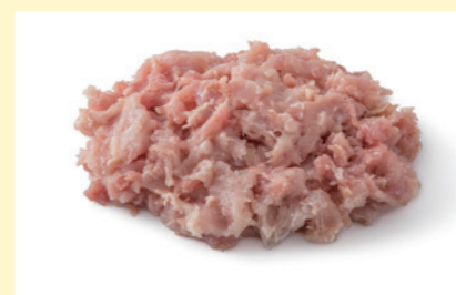
熟れ鶏-5 冷凍 受注生産