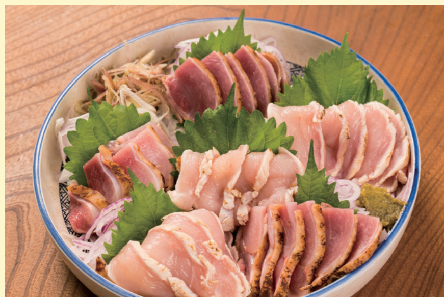
調理例/モモタタキ・ムネタタキ 主に九州地方では、表面を焼いたタタキとして食されます。

生産者：株式会社十文字チキンカンパニー 岩手県二戸市石切所字火行塚 25 TEL 0195-23-3377 FAX 0195-22-4366